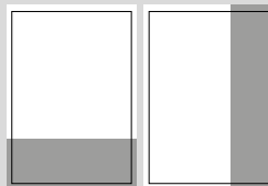
1/3 SEITE QUER ODER HOCH