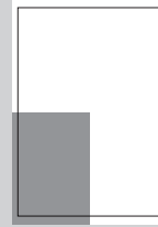
1/4 SEITE ECKFELD

MALSTAFFEL BEI ABNAHME INNERHALB EINES JAHRES: